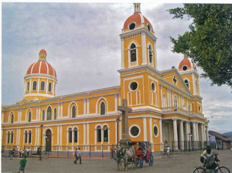
Ciudad de Granada

Como dije anteriormente, Nicaragua es un país de oportunidades que, además de calidad de vida, ofrece un sinnúmero de oportunidades de inversión.