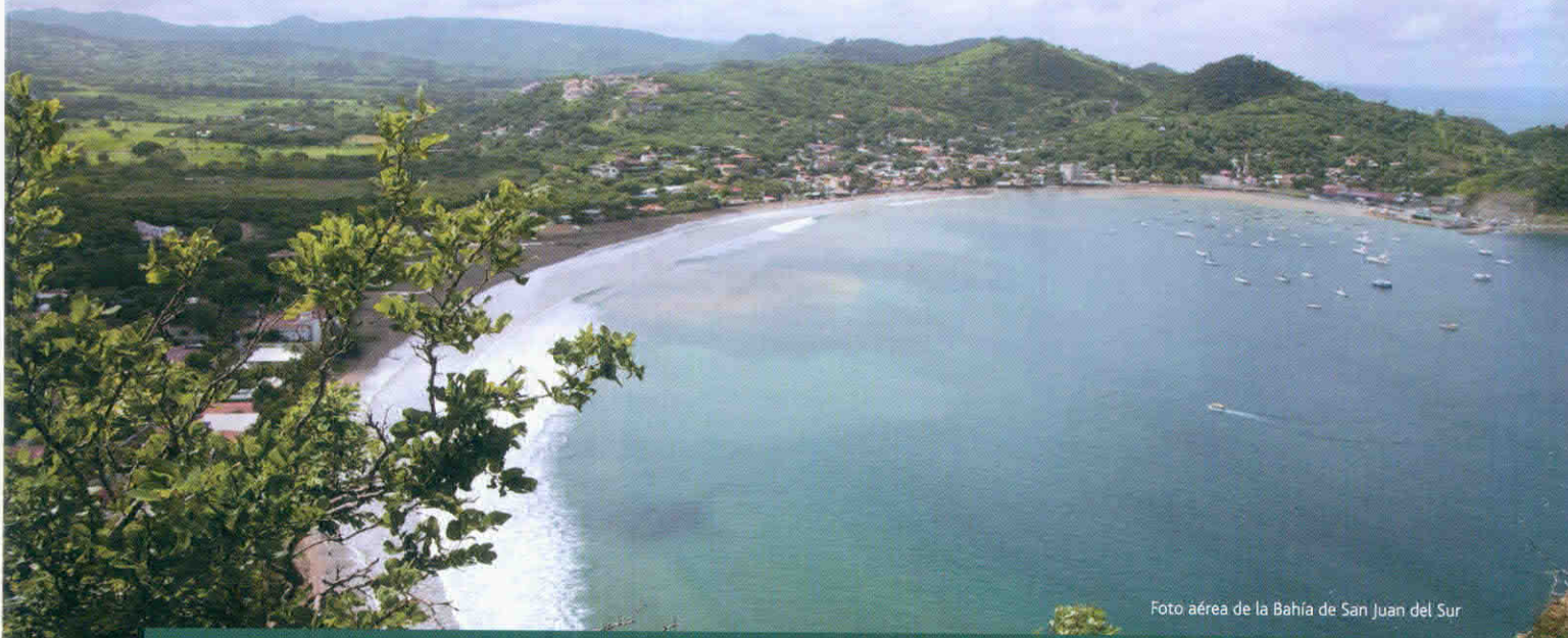
Foto aérea de la Bahía de San Juan del Sur